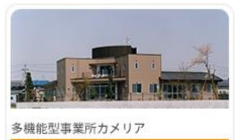
多機能型事業所カメラ

プログラムの中で、病棟内を見学していただく予定です。療養環境への配慮及び守秘義務遵守のため、今回の例会は会員限定とさせていただきます。また、病棟見学前に、参加者の皆さんに秘密保持への配慮を重ねてお願いする予定でありますので、どうかご了承ください。