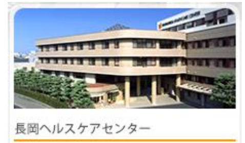
長岡ヘルスケアセンター

当協会では一昨年前から、「PSWとして、入院治療に関してこれだけは知っておいてほしい」という思いを込めて、病院見学を実施してきました。「どんな形で入院治療が始まるのか」「入院中はどんなところで治療が行われるのか」「退院までにどんな流れがあるのか」など、具体的なイメージが持てるような研修の機会にしたいと思っています。