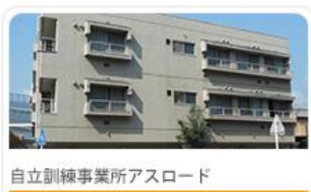
自立訓練事業所アスロード

今回は、長岡京市にある長岡病院に見学を依頼しています。精神科病院を訪れた経験の無い方だけでなく、他の病院に勤めるPSWの方も、ぜひぜひご参加ください。